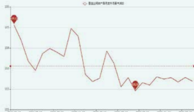
图3 盛泽市场丝绸产品景气指数走势图

1. 寒潮来袭，影响桑园。 寒潮将继续影响我国江汉、黄淮、江淮、江南等地。部分地区桑园的桑树枝条上部萌芽和下部萌芽遭受冻害，将影响发种时间，蚕丝的生产也会受到一定影响。