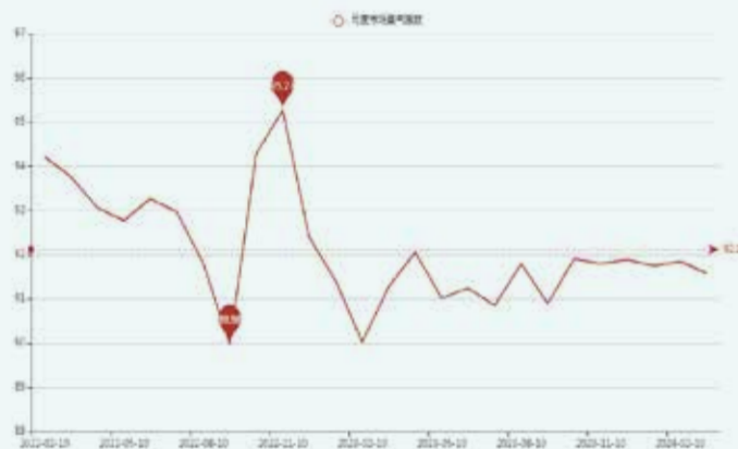
图1 盛泽市场整体景气指数走势图

分析可见，2月订单情况总体下降，月初受春节影响市场休市，直到月中复市。国内方面，复工后不少企业就接到订单开始忙碌生产，新单下达有所放量。国外方面，国际形势依然严峻，总体需求预期偏弱，外贸需求数量缓慢增长，外单数量略有下达。原料方面，春节后受国际原油影响，拉高了原料价格，下游工厂逐渐复市，需求低迷。预计随着“金三”旺季到来，市场景气度将有所上升。