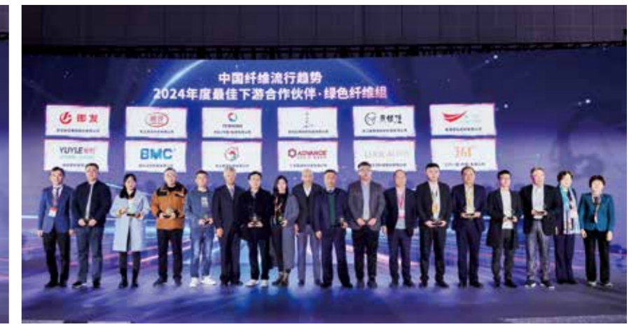
最佳年度合作伙伴奖分绿色纤维和科技创新组，共有 24 家企业获此殊荣。