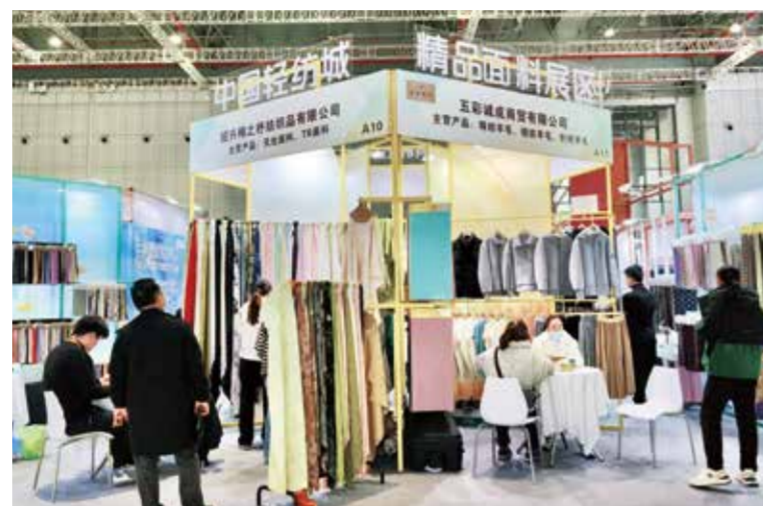
中国轻纺城展区多款新品面料受到来往客商青睐。

本次展会期间,中国轻纺城集团充分利用线上线下融合的优势,在集团所属各市场大屏直播展会现场盛况,同时在展会现场设置大屏投放各市场通道实时人流状况,通过这种线上线下同步直播的方式,不仅吸引了更多观众的关注和流量增长,也进一步提升了中国