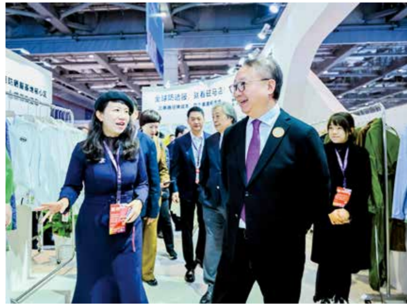
展会上,驻马店防晒服基地展区吸引了众多国内外嘉宾参观交流。