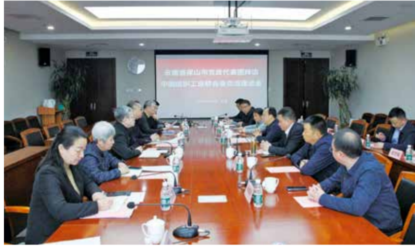
会议对未来保山纺织服装产业发展进行了深入沟通和交流。

近日，云南省保山市党政代表团赴中国纺织工业联合会拜访交流座谈会在京举行。云南省保山市市委书记杨军带队，携5个县（区）、市党政负责人与中国纺织工业联合会会长孙瑞哲、秘书长夏令敏等相关负责人对未来保山纺织服装产业发展进行了深入沟通和交流。