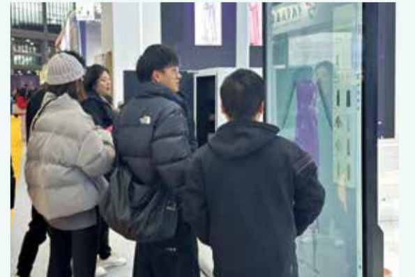
凌迪 Style3D 展位一派繁忙景象。