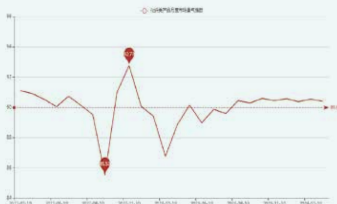
图2 盛泽市场化纤产品景气指数走势图

1. 春节放假，出货和生产量均大幅下降。 假期是影响2月份景气指数的最重要因素。2月份，纺织业的生产和供应链受到一定影响，春节结束后工人返岗时间较晚，恢复生产缓慢，导致纺织品的生产和出货量下降。整个市场的生产时间较1月减少一半，出货量也相应减少了一半以上。