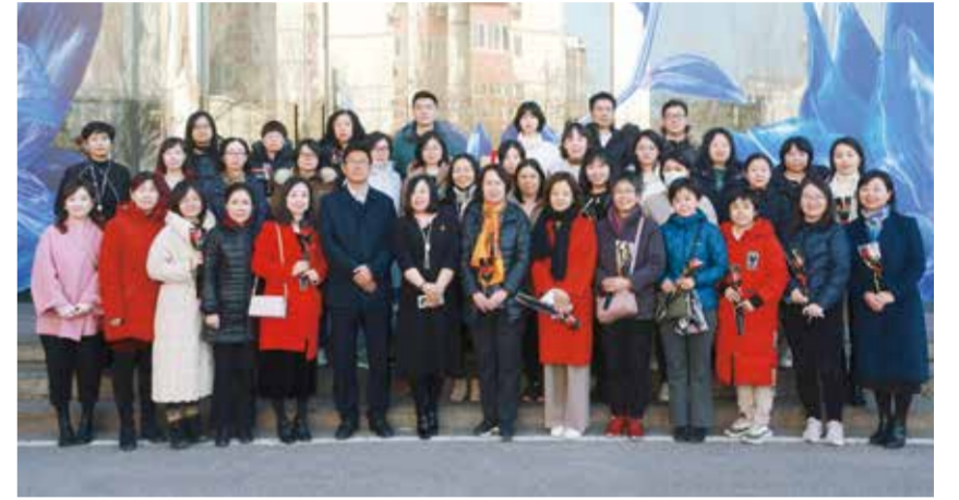
中国纺联工会组织女职工先后参观了爱慕美术馆、皇锦非遗文化展和产品展厅。

爱慕的产品凭借其卓越的品质和独特的魅力，成为了广大女性心目中的知心好友，爱慕将传统文化与现代生活碰撞之后，绽放出了独特魅力与纺织行业文化自信之美。