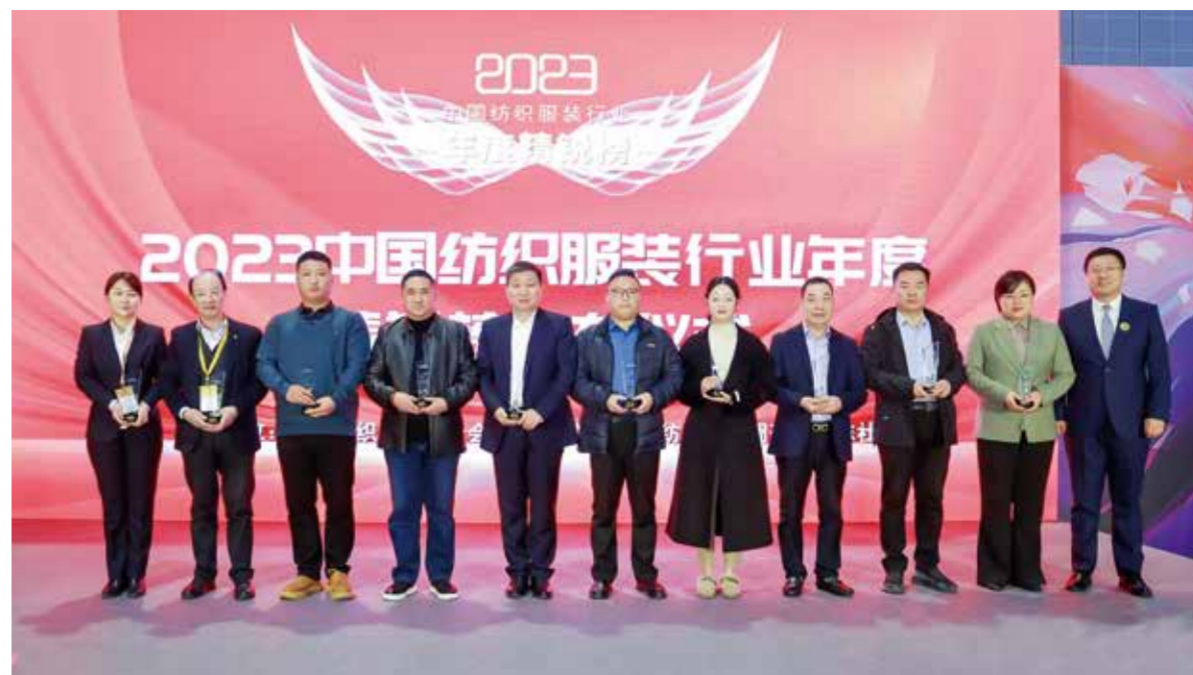
发布仪式汇聚了百余位嘉宾共襄盛举。

春光不相负,勤耕雨露时。PH Value 中国国际针织博览会经过多年的创新发展与行业积淀,致力于打造最具创新性、时尚性、前瞻性的集商贸、科技、设计、趋势于一体的综合交流服务平台,赋能现代化针织产业体系建设,以优质服务生产力共推行业高质量发展新未来。TA