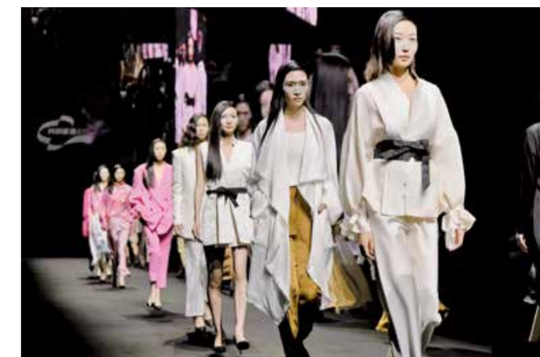
柯桥品牌走进湾区。

凭借大湾区的区位和平台优势,本次活动多维度展示出凝聚纺织最新技术和创意的柯桥面料,提高了“柯桥优选”区域公共品牌