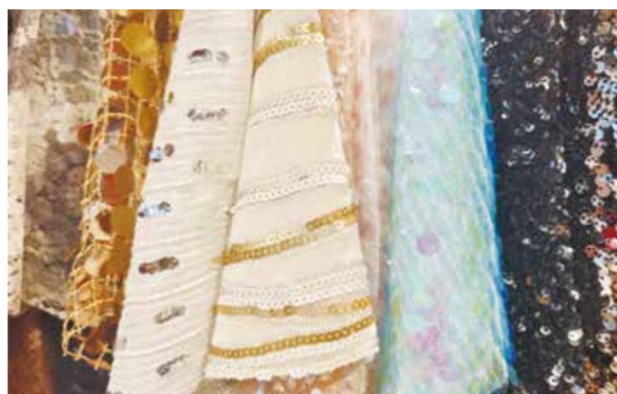
纺城柯桥正用实际行动写下如何发展新质生产力的精彩答卷。