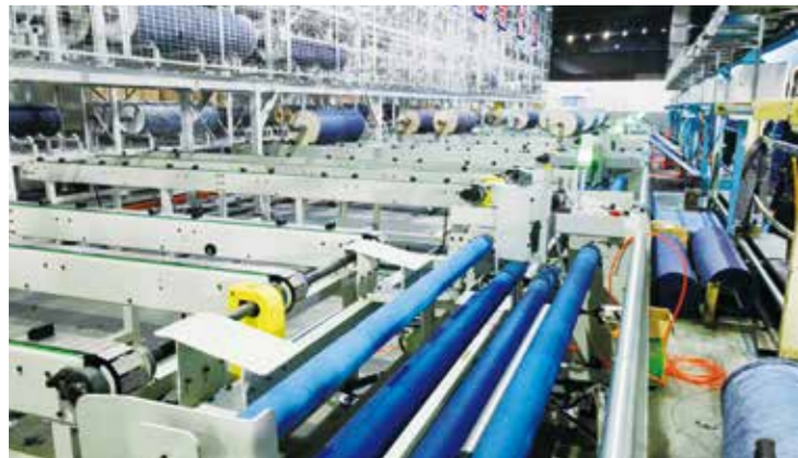
智能化正成为纺织工厂的新标志。

发布单位：中华人民共和国商务部 编制单位：中国轻纺城建设管理委员会 “中国·柯桥纺织指数”编制办公室 中文网址：http://www.kqindex.cn/ 英文网址：http://en.kqindex.cn/ 电话：0575-84125158 联系人：尉轶男 传真：0575-84785651