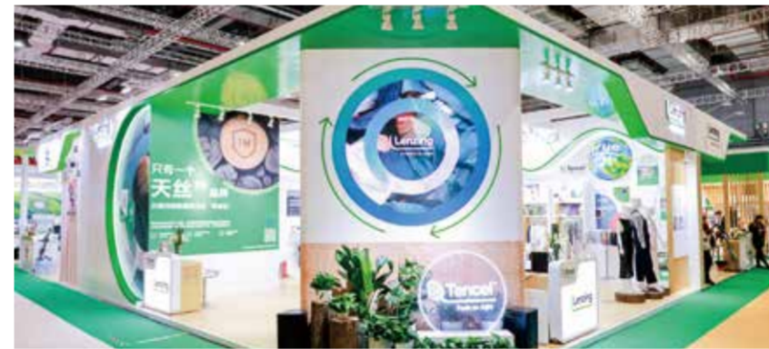
兰精集团展出了多款创新绿色纤维。

3月6—8日，兰精集团以“绿色创新 低碳循环”为主题，参展2024中国国际纺织面料及辅料（春夏）博览会。展会现场，兰精集团重磅展示了兰精™莫代尔 Sun 纤维、天丝™莱赛尔 LPH 纤维、兰精™环生纤™黑色粘胶、兰精™环生纤™×悦菲纤™纤维等创新纤维产品，从源头领航可持续时尚，打造循环经济新风向。