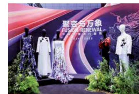
桐昆·中国纤维流行趋势 2024/2025 的空间设计传递“龙启万象新”的视觉意象。