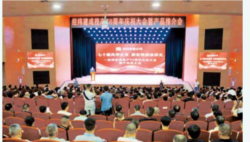
会上，经纬智能公司对70年锻造的经典纺机进行回顾，并对四大主机新产品进行了推介。

国机集团党委书记、董事长张晓仑谈到，“锻造国机所长，服务国家所需”，是每一个国机人必须担负的职责和使命。2023年，国机集团全面启动“振兴纺织机械三年行动”，恒天集团坚决扛起振兴民族纺机的大旗，在锻造核心竞争力、扩大品牌影响力等方面取得了新的突破，建成了国内第一个智慧纺纱工厂，攻克了一系列卡脖子技术，研制了一批首台（套）产品装备，树立了行业智能制造新标杆，巩固了经纬品牌国内第一、全球第三的市场地位。他表示对恒天集团、对经纬纺机的发展充满信心。