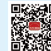
纺织机械 微信订阅号