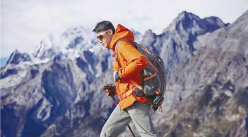
波司登持续开发绿色新产品。

在质量保障方面，波司登制定了《供应商化学品管控手册》，提升对供应商化学品管控的要求，并加入有害化学物质零排放联盟（ZDHC）；2023