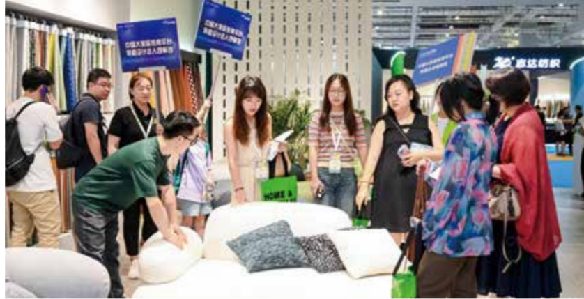
2024intertextile家纺展将汇聚来自国内外的优势品牌与创新产品。图为往届展会。

装系列。今年即将第24次组团参展的杭州临平家纺展团，共集结123家企业将展示沙发布及窗帘产品。来自中国沙发布生产基地的桐乡家纺展团，将带来集面料织造、成品加工、印染后整理、产品设计等于一体的主导产业和区域特色品牌。从原材料、印染、装备、织造到家纺家居，绍兴集群的参展商呈现出产业链条长、覆盖面广特点。湖州长兴家纺展团将重点推介春亚纺、磨毛布、经缎、提花布、遮光布、平布、金光绒等30余个品种的家纺面料及窗帘布。吴江盛泽展团的展示重点涵盖仿麻布、麂皮绒、灯芯绒、雪尼尔等多种深加工高档沙发和窗帘布料。土耳其展团及比利时展团的展品种类繁多，主要集中于床上用品面料、窗帘面料、桌布及靠垫套等。