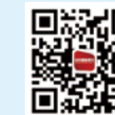
纺织服装周刊 新浪微博