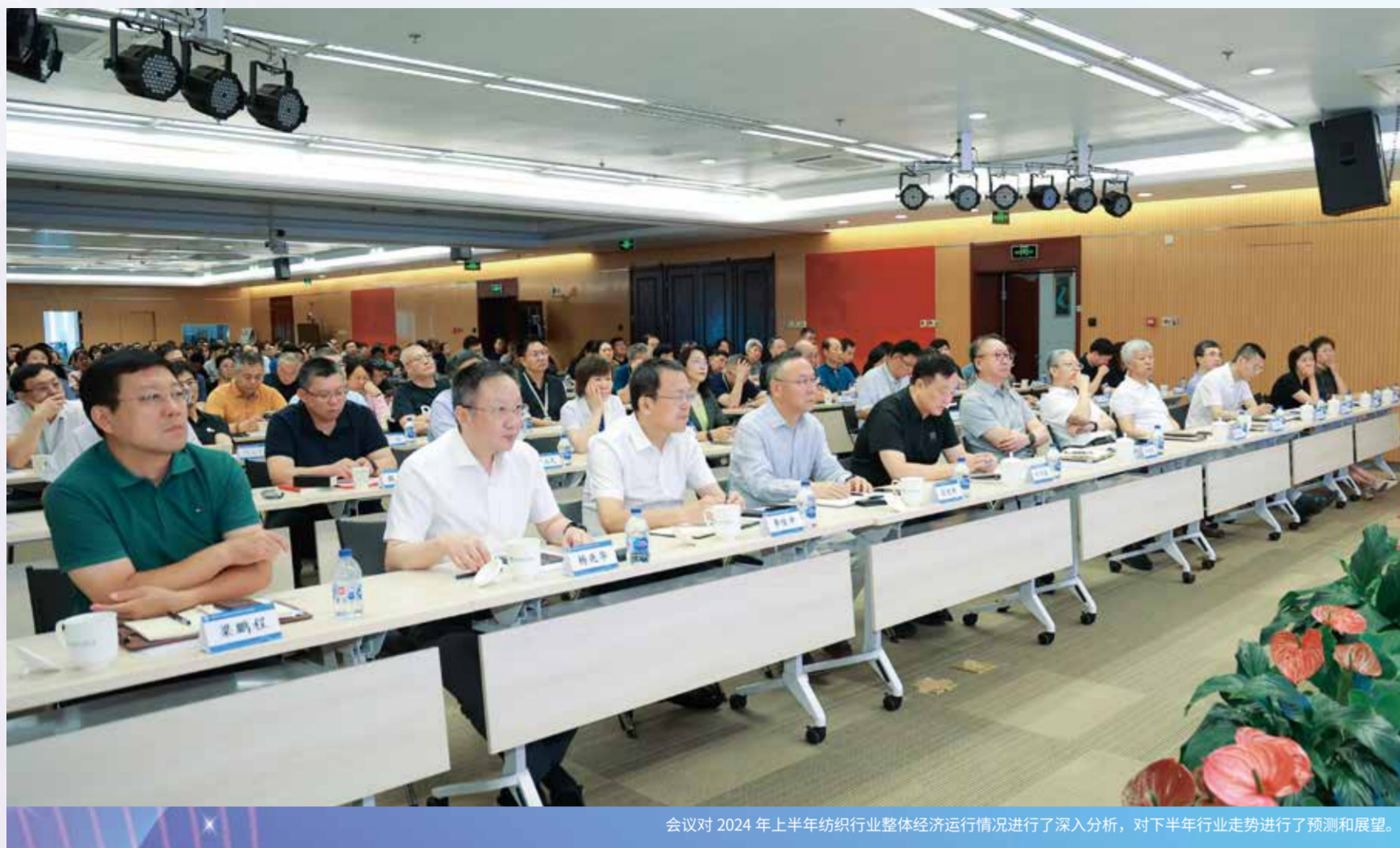
会议对 2024 年上半年纺织行业整体经济运行情况进行了深入分析，对下半年行业走势进行了预测和展望。