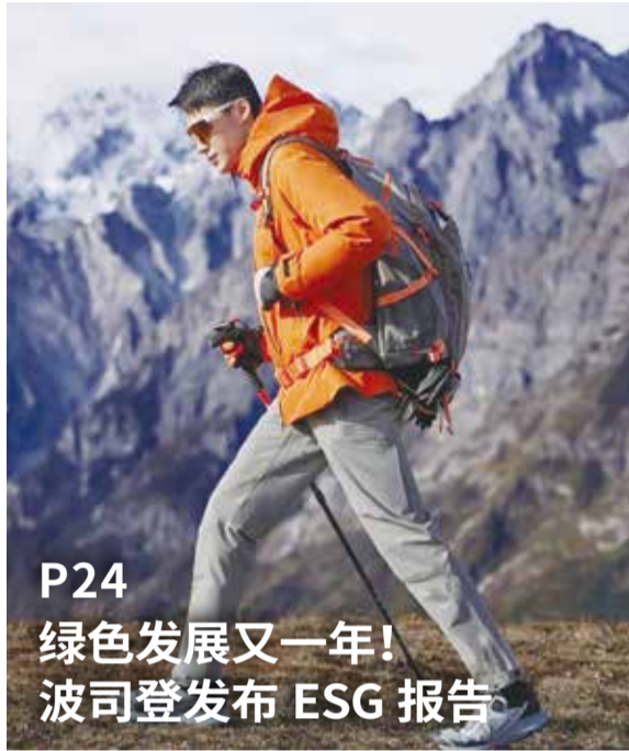
P24 绿色发展又一年！ 波司登发布 ESG 报告