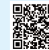
纺织服装周刊 网易号