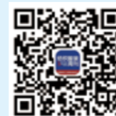
纺织服装周刊 微信订阅号