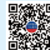
纺织服装周刊 微信视频号