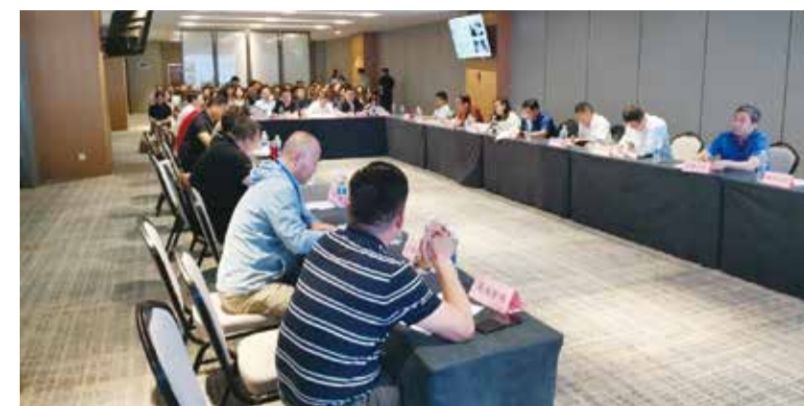
会议同期举办了“中国棉纺织行业协会原料产业链分会会议”。