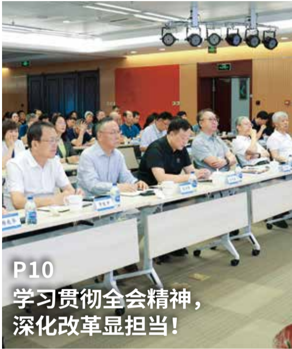
P10 学习贯彻全会精神， 深化改革显担当！