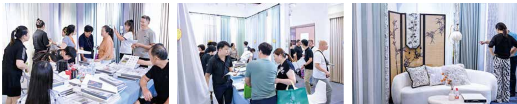
数以万计的新品体量，尽显源头展会“一站式”采购优势。