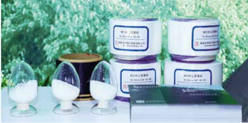
永荣股份在绿色产品研发上不断攻坚克难，重磅推出消费后再生锦纶纤维。

共同的心声。当绿色发展遇上新质生产力，企业如何找到发展绿色生产力的融合点？又该如何以高质量供给引领和创造市场新需求，提供可持续解决方案？