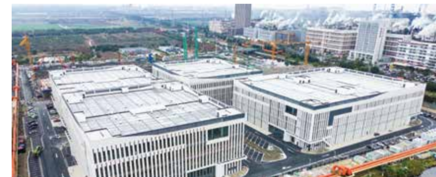
未来，园区将形成智能化产业社区。

此次活动聚焦柯桥纺织时尚产业与设计创新人才的深度融合，力求为产业发展开拓新路径。随着“经纬人才计划”的持续推进，柯桥正加速从“世界面料库”向“国际时尚策源地”转变。未来，更多优秀设计师的加入将推动柯桥纺织时尚产业迈向高质量发展新阶段。（边吉洁）