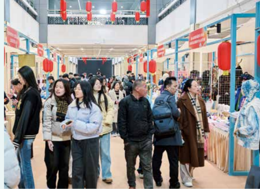
对接会现场人潮涌动。