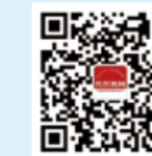
纺织机械 微信订阅号