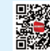
纺织服装周刊 今日头条号