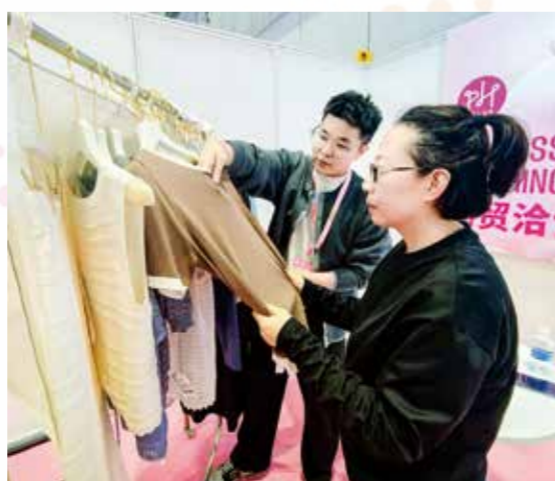
展会为2025年的针织市场照亮了前行方向。