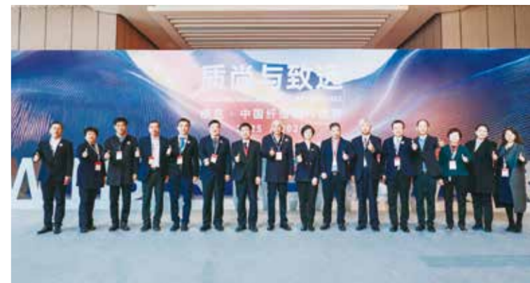
与会领导嘉宾合影。

值得关注的是，铁人三项世界冠军苗浩携夫人压轴登场，踏光而行。“在运动领域，功能性纤维的应用日益广泛且深入，发挥着不可或缺的作用。比如，吸湿速干纤维面料能够快速吸收并排出汗水，减少衣服的重量，帮助我们在训练或比赛中保持皮肤干爽，更快恢复舒适感；柔弹纤维能让面料具有出色的弹性和贴合性，让我们能自由舒展身体，并减少额外的阻力，有助于我们更好地发挥自己的水平。”苗浩说道。