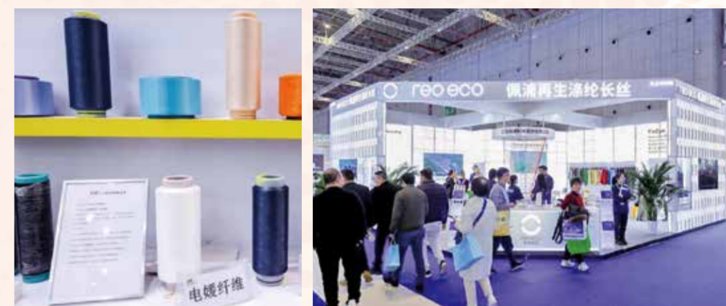
特色纱线激活采购市场。

2025 yarnexpo 春夏纱线展不仅是纤维纱线的海洋，更是纺织科技革命的“阅兵式”。盛虹集团有限公司将二氧化碳变成纤维、上海德福伦新材料科技有限公司与浙江佳人新材料有限公司联合研发出防透紫外循环再利用聚酯纤维、浙江桐昆新材料研究院有限公司的低温易染生物基呋喃聚酯纤维……展示了纺织源头的科技担当，也无声宣告着纺织业与地球共生的承诺。