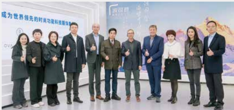
波司登与戈尔公司的深化合作，为行业高质量发展树立新标杆。

LMV821KF拉幅定形机项目开发了分段式可嵌套移动密封装置，提高了定形机的可加工幅幅，提升了对宽幅长绒类产品的加工适应性；开发了电动调幅装置，提升了工作稳定性；设计了可调节式风筒，提高了宽幅烘房内部工作温度均匀性；设计了双头排风管道，扩大了排风调节范围；研发了烘房湿度自动控制系统，降低了热定形能耗，节约了生产成本。（纺织）