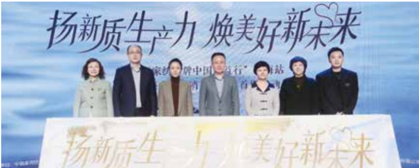
在嘉宾的见证下，覆盖上海全域的家纺补贴活动正式启动。

在大宗消费更新升级行动方面，《方案》要求加大消费品以旧换新支持力度。在服务消费提质惠民行动中，提出释放银发消费市场潜力、扩大文体旅游消费、推动冰雪消费等。在城乡居民增收促进行动中，提出实施重点领域、重点行业、城乡基层和中小微企业就业支持计划。（郝杰）