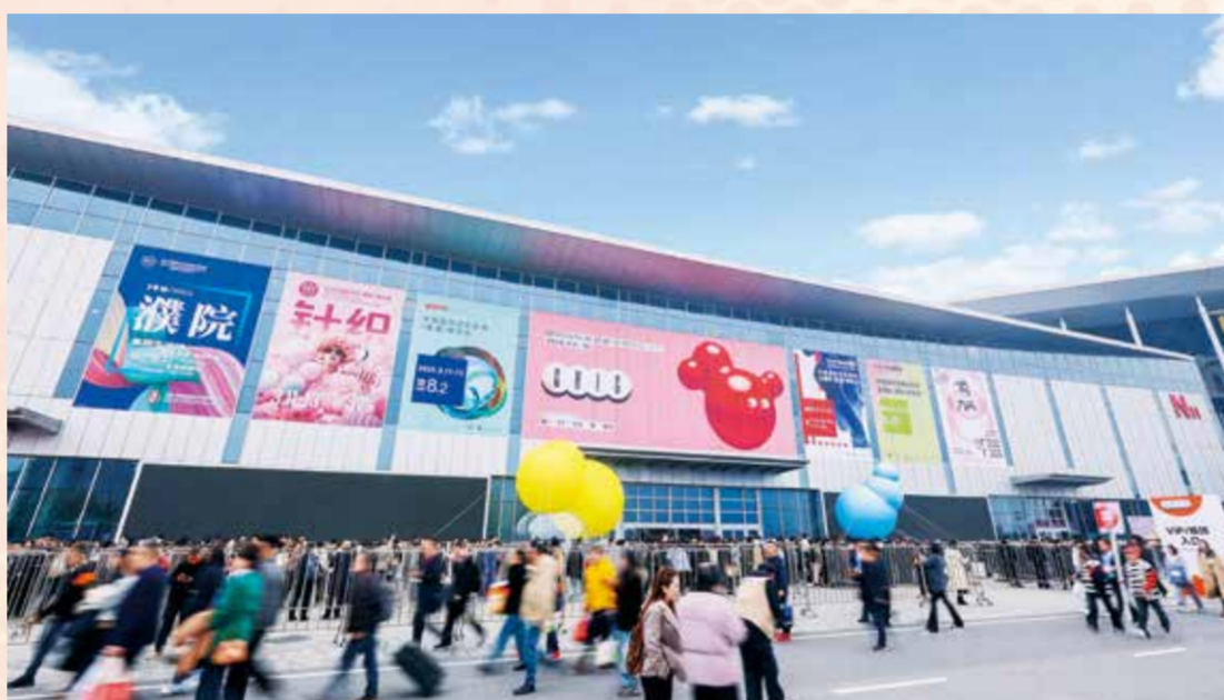
春季联展吸引海量人流。

步提升了展会的国际影响力，成为全球纺织行业不可或缺的重要平台。国际采购商纷纷表示，展会不仅是高效对接的平台，更是洞察全球纺织行业趋势的重要窗口，进一步凸显了展会的国际影响力。