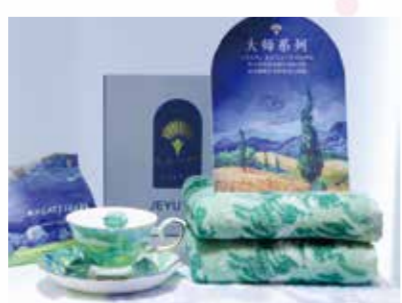
展会透露着家纺行业的创新与活力。