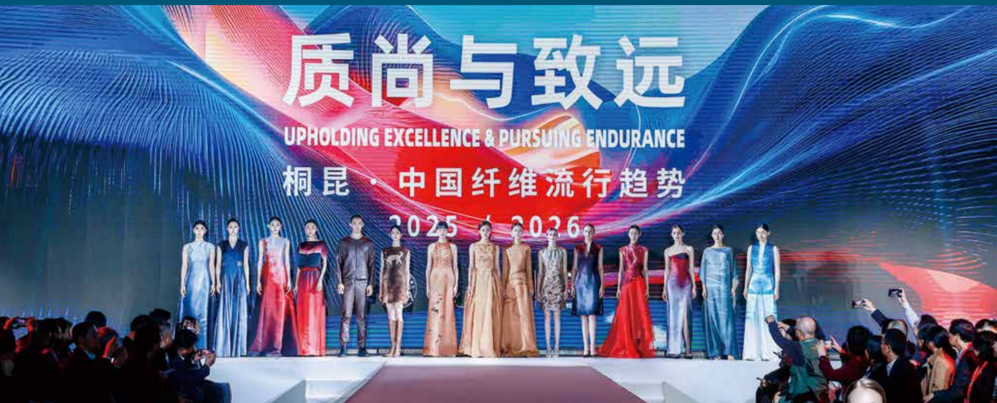
发布会让人们感受到了纤维行业的新质发展与可持续愿景。